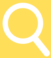
Tabla de Precios Albondigas